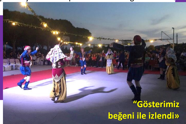
"Gösterimiz beğeni ile izlendi"