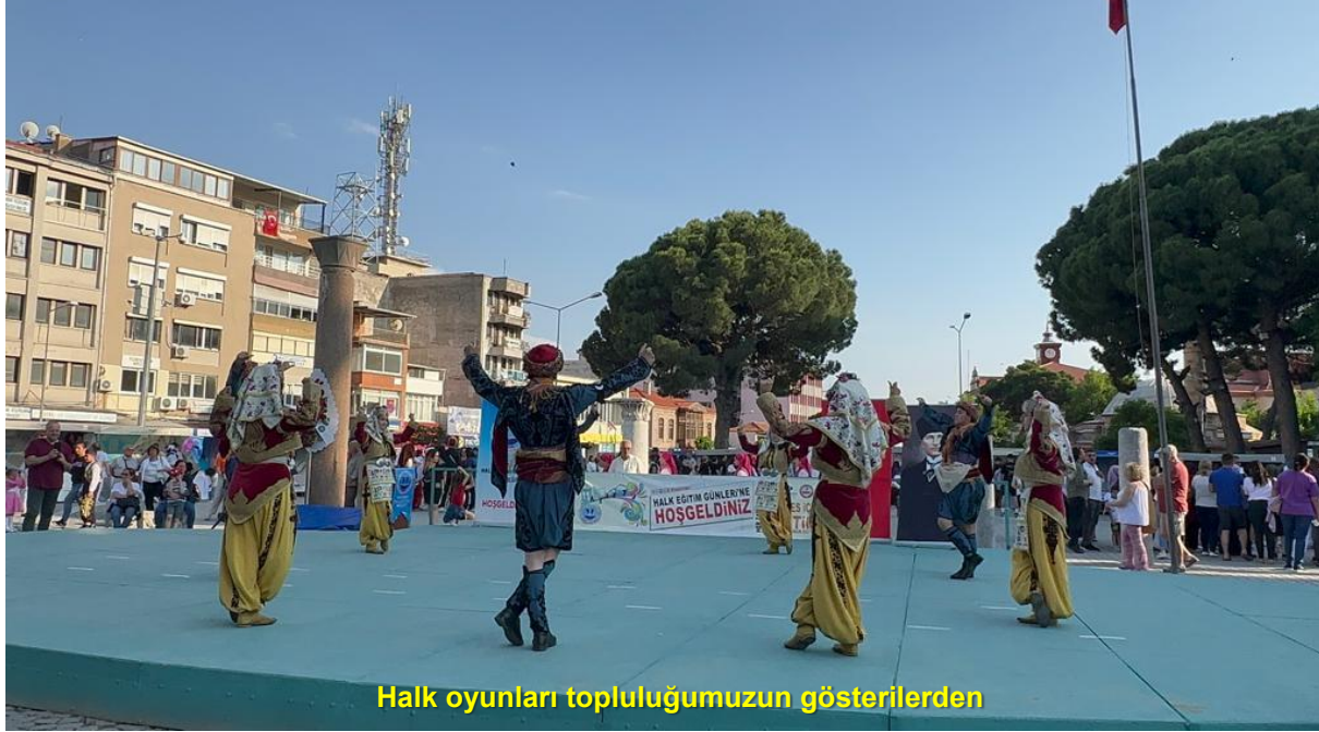
Halk oyunları topluluğumuzun gösterilerden