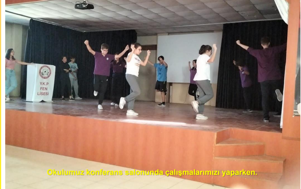
Okulumuz konferans salonunda çalışmalarımızı yaparken.