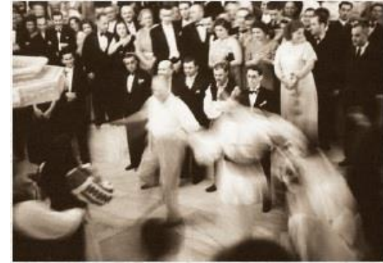
Zeybek oynarken, Beylerbeyi Sarayı, İstanbul, 2-3 Eylül 1936.

Atatürk sadece başarılı bir asker, büyük bir devlet adamı değildir. Aynı zamanda bir halk bilimcidir. Türkiye Cumhuriyeti'nin temeli kültürdür. Millî kültürümüzü çağdaş uygarlık seviyesinin üstüne çıkaracağız. Millî kültürün her çığırda açılarak yükselmesini, Türkiye Cumhuriyeti'nin temel dileği olarak temin edeceğiz. Sanatsız kalan bir milletin hayat damarlarından biri kopmuş demektir. Musikisiz hayat mevcut olmaz, müzik hayatın neşesi, ruhu sevinci ve her şeyidir. Bizim gerçek müziğimiz Anadolu halkında işitilebilir. İlim tercüme ile olmaz, tetkikle olur.