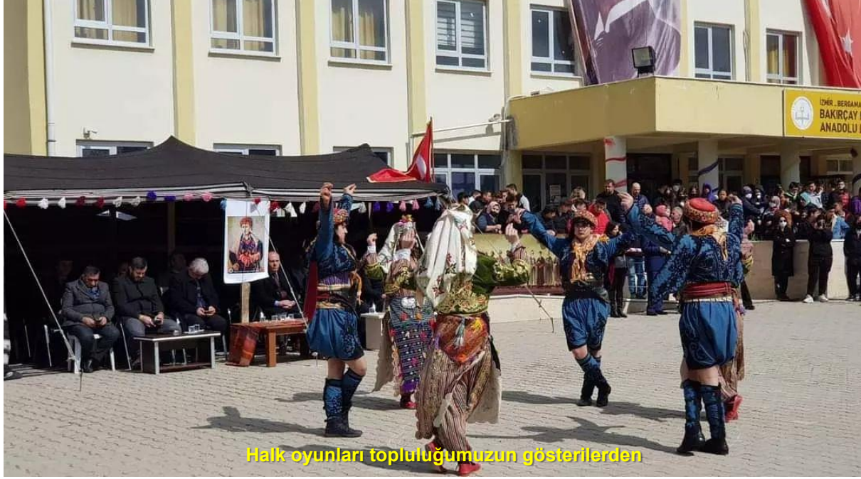
Halk oyunları topluluğumuzun gösterilerden