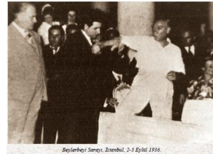
Beylerbeyi Sarayı, İstanbul, 2-3 Eylül 1936.

Bu festival Türkiye'de düzenlenen ilk uluslar arası halk oyunları festivalidir. Yurdun dörtbir yanından gelen halk oyunları toplulukları ile Balkan ülkelerinden gelen (Arnavutluk, Bulgaristan, Romanya ve Yunanistan) halk oyunları toplulukları katılmıştır. 1936 yılında (Ağustos) 2. Balkan Festivali yapılmıştır. Bu olay da ülkemizdeki festivallerin başlangıcı olması bakımından önemlidir.