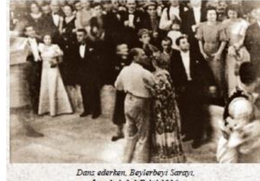
Dans ederken, Beylerbeyi Sarayı, İstanbul, 2-3 Eylül 1936.