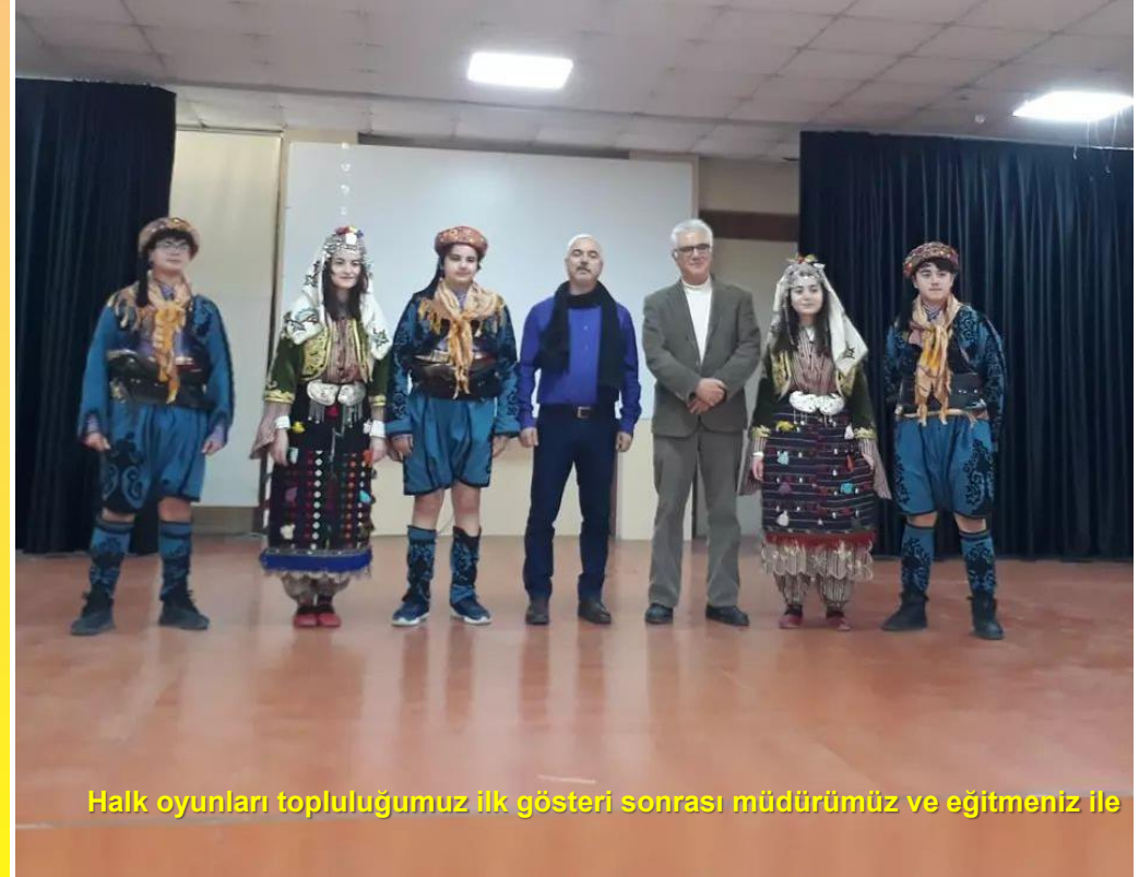
Halk oyunları topluluğumuz ilk gösteri sonrası müdürümüz ve eğitimimiz ile