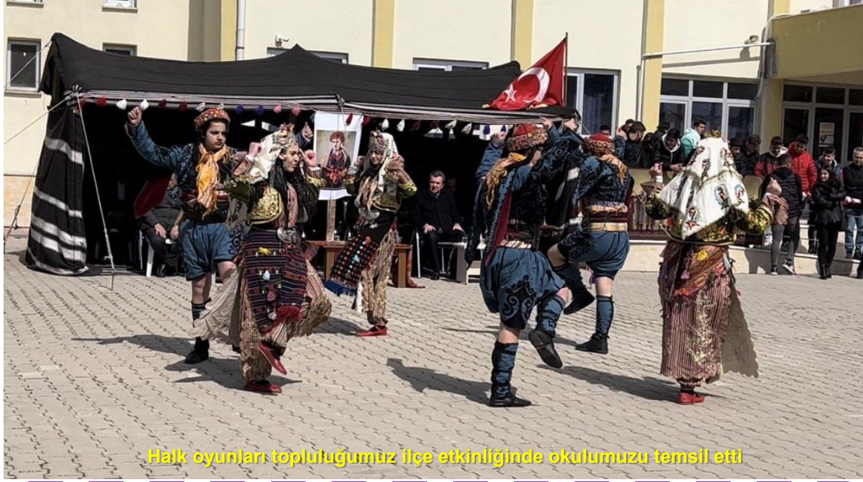
Halk oyunları topluluğumuz ilçe etkinliğinde okulumuzu temsil etti